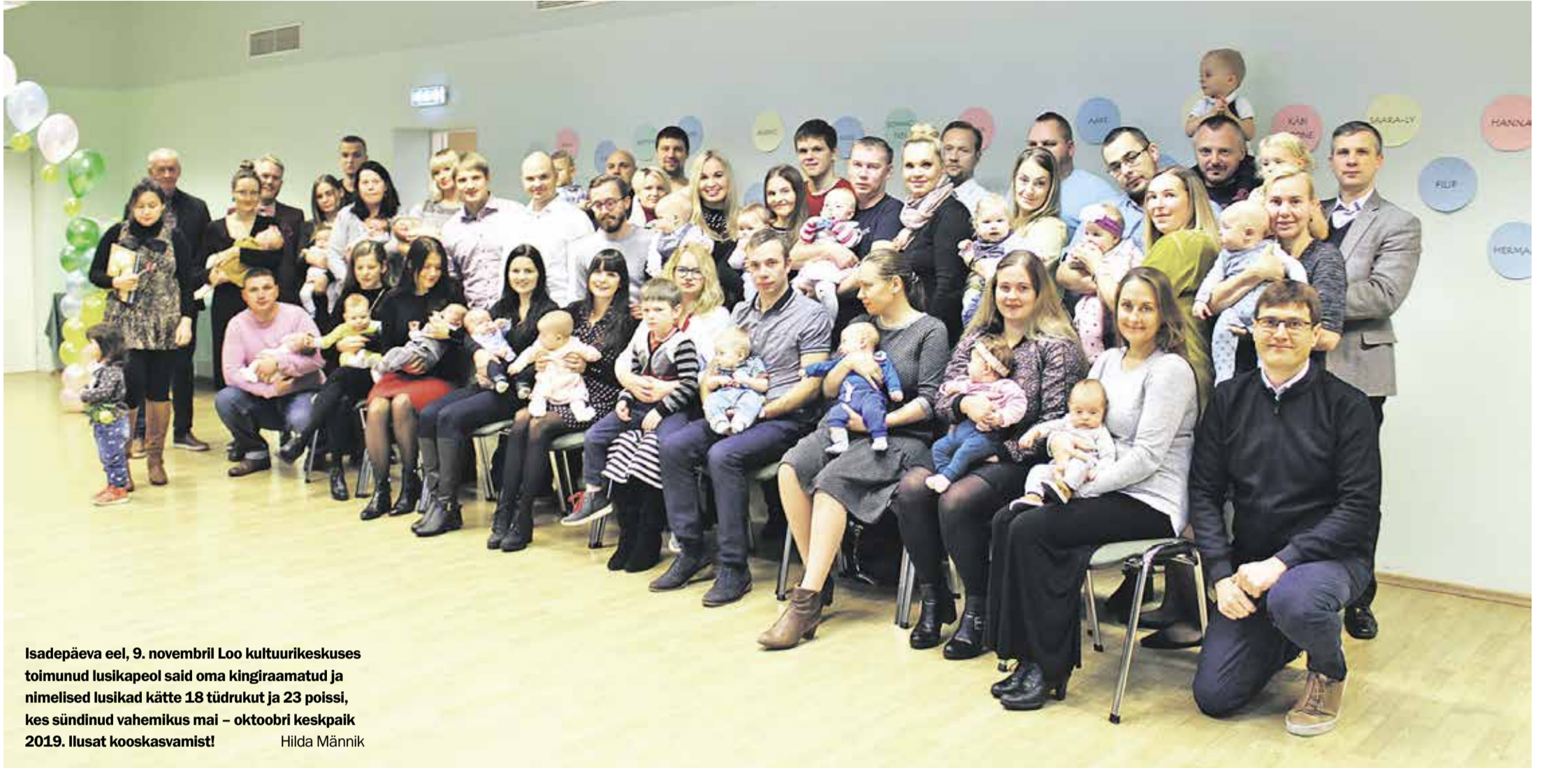
Isadepäeva eel, 9. novembril Loo kultuurikeskuses toimunud lusikapeol said oma kingiraamatud ja nimelised lusikad kätte 18 tüdrukut ja 23 poissi, kes sündinud vahemikus mai – oktoobri keskepaik 2019. Ilusat kooskasvamist! Hilda Männik