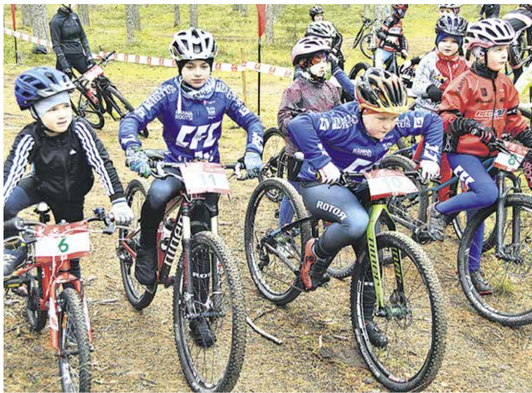
Lapsed ootavad õhinal stardimärguannet.

Kell 12 startisid täiskasvanud, kelle hulgas hakkas silma nii noorukeid kui ka halli habemega taate. 18 kilomeetrit läks kirja matkasõiduna, 35 kilo-