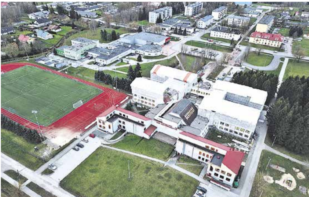
Droonifoto Loo kooli ehitusest, 7. november 2019.

„Alustaksin ajast, kui maja ehitajale üle anti. 12. juunil andis ehitaja teada, et ehituse põhiprojekti valmimine on planeeritud juuli lõpuks e töövõtja esitab esialgse graafiku juuli esimestel päevadel, ehitustööde detailne graafik esitatakse pärast põhiprojekti valmimist ja ehitustöödega alustatakse au-