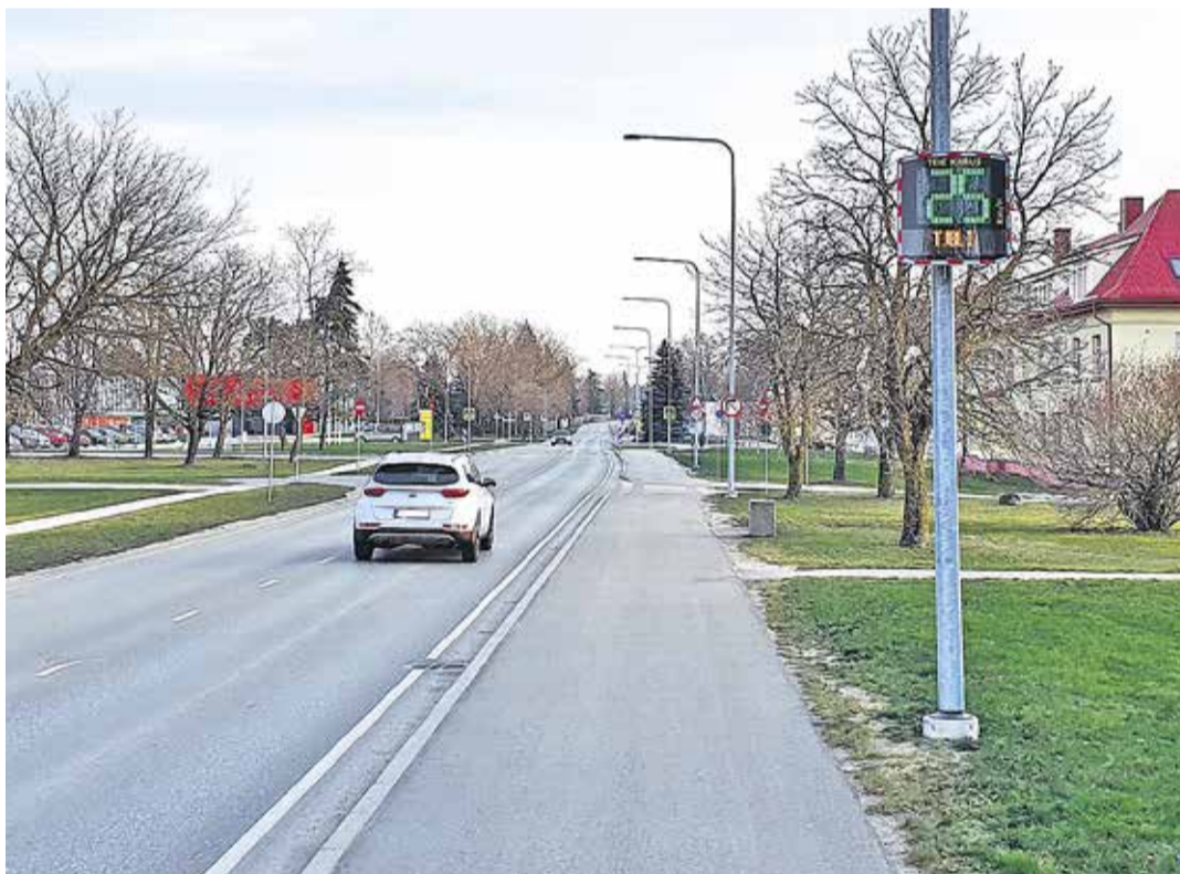
Kiirustabloo Lool Saha teel.

Noortegarantii tugisüsteemi on vähemalt korra nelja seire jooksul kasutanud 68 kohalikku omavalitsust. Jõelähtme vald liitus noortegarantii tugisüsteemiga 2018. aastal. •